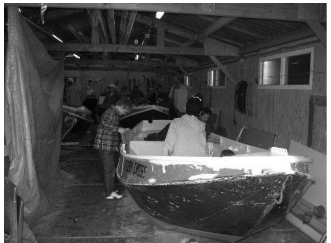
De Fiery Cross wordt onderhanden genomen.

Toen de boten het water uit gingen werd de onderkant goed schoongespoten en pokkenvrij gemaakt. Allemaal kregen zij een plekje in de loods. Als een zwem bijen vlogen de verkennersexamen, gewapend met staalborstels en krabbers neer op de boten. Na een paar opkomsten flink te hebben geschuurd en gekrabbd, werd hier primer overheen gesmeerd (de grondlaag). Nu zitten er al weer twee lagen glans op en ook de oranje rand aan de zijkant van de boot is onder handen genomen. De boten zijn dus klaar om gedraaid te worden.