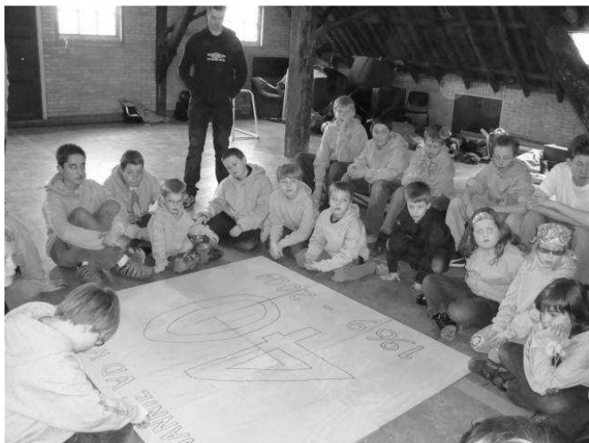
De nu nog kale planken

Dit bord komt op de loods te hangen in plaats van het sponsorbord.