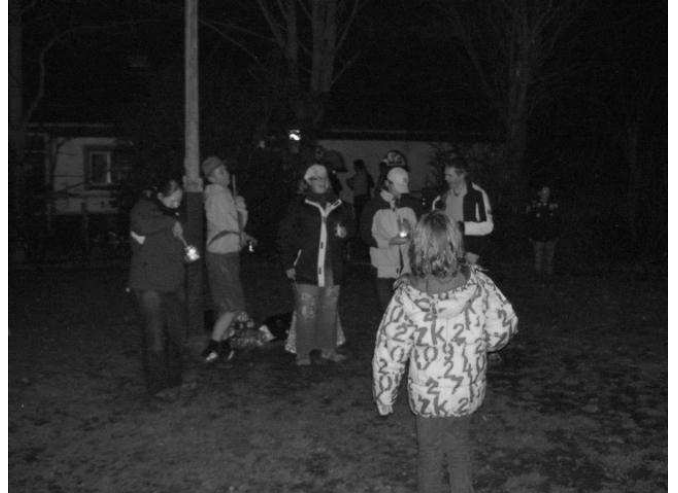
Het "aansteekteam" staat klaar met brandende kaarsjes.

Het eerste avondspel wat we deden was een kaarsjes spel. De ene groep moest kaarsjes in een potje naar de overkant brengen. De andere groep moest de kaarsjes uitblazen. Het was heel leuk om te doen. Het was ook wel moeilijk, want ze gingen zich verstoppen. En de wind blies de kaarsjes ook uit.