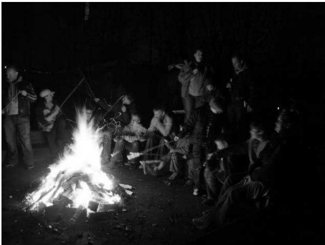
Het hele hete kampvuur.

Andere kinderen bleven nog even buiten bij het kampvuur, tot het vuur uit moest.