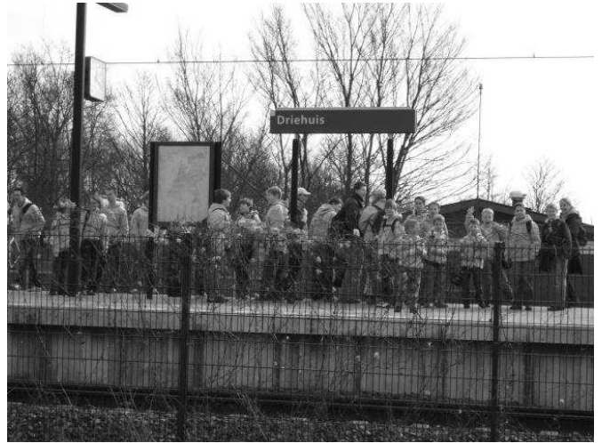
We staan met z'n alle te wachten op de trein.

busjes vertrekken met de bagage en gaan in Uitgeest meteen even boodschappen doen.