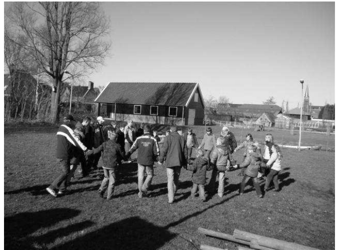
De hele groep gaat in de knoop.

elkaar beter te leren kennen en bij Kimara en mij spelen ze de perenrace. De kinderen hebben veel plezier.