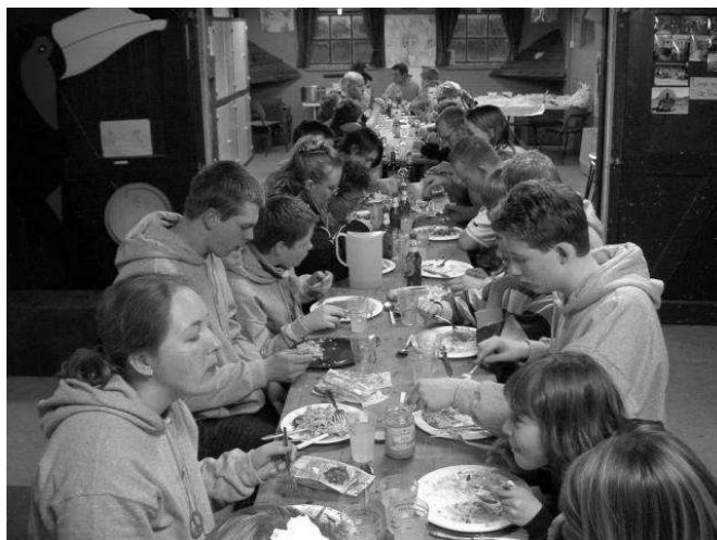
Met z'n alle eten aan 2 lange tafels.