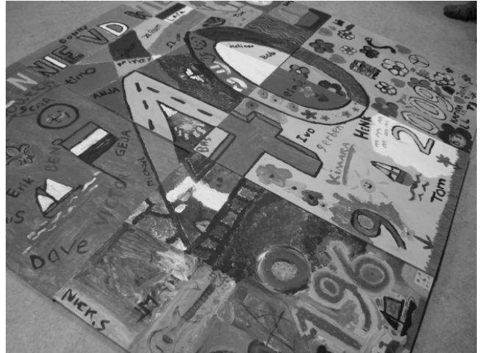
In kleur binnenkort te bewonderen op de botenloods.

Daarna gingen we naar beneden om te schilderen. We hebben een jubileumbord geschilderd. Het is een heel apart geheel geworden.